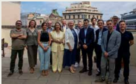
Roda de premsa del Festival d'Òpera de Saaremaa (Estònia) Juliol 2024